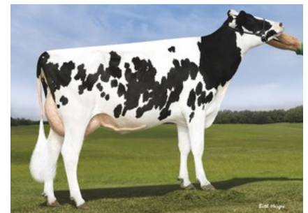
4. M: S-S-I Moonry Myesha 9071-ET