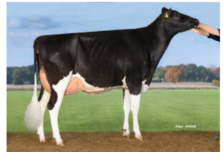
M: SH Jackpot