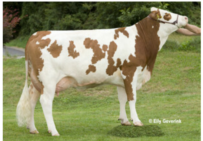
VULCANO - LIBELLE