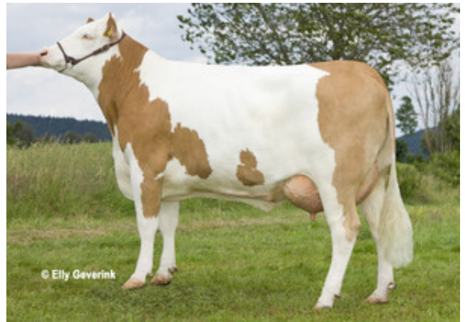
WABAN - ELMA