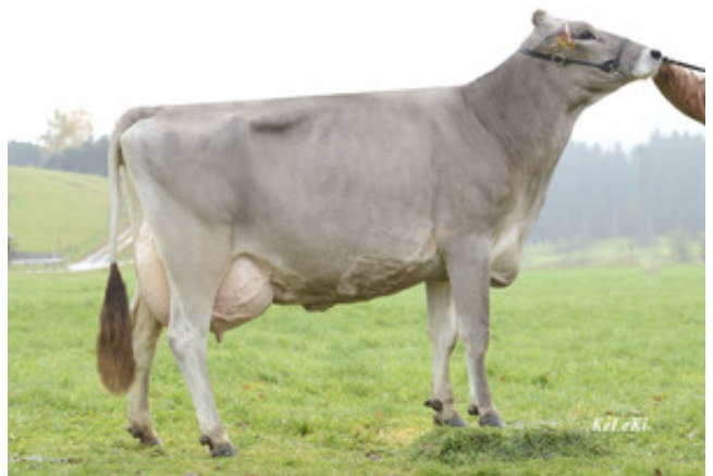
VASIR - SIDNEY