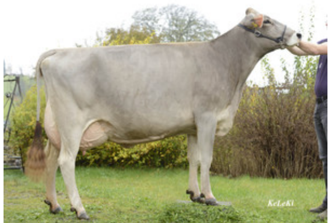
VASIR - DANI